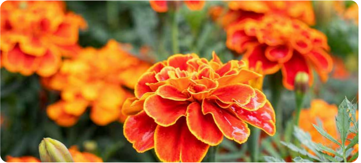
Ringelblumenblüten

Wir wünschen allen Mitgliedern, die im November Geburtstag haben, alles Gute!