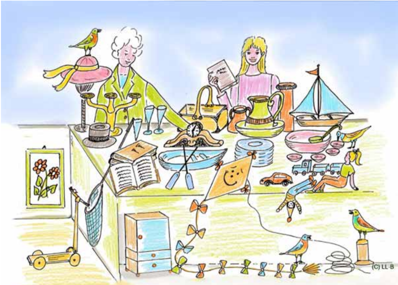
Foto oder Ausschnitt mit der Lösung an den Bürgerverein schicken. Es wird unter allen richtigen Einsendungen ein Gutschein für ein Geschäft / Restaurant in Höhe von 25€ verlost. Der Rechtsweg ist ausgeschlossen. redaktion@bvfo.de / Einsendeschluss ist der 1.11.2024