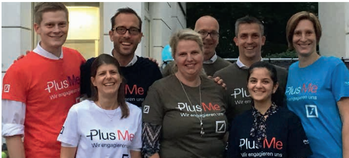
Das Team der Deutschen Bank auf dem Lichterfest 2018

Deutsche Bank Mitarbeiter unterstützten erneut Hamburger Kinderstiftung // Strumpflädchen sammelte für „Ärzte ohne Grenzen“