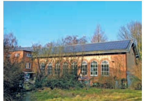
Die Sporthalle am Röbbek

Bauantrag wurde im Dezember 2015 eingereicht. Näheres zu den Architekten (Büro, Werdegang, Mitarbeiter usw.) finden Sie auf der Website der LH-Architekten www.lh-architekten.de . Dort ist auch eine Animation zu sehen sowie ein Plan, wo die Häuser entstehen sollen.