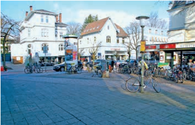
Platz an der Waitzstraße

Wir haben diesbezüglich bereits mit vielen Mitgliedern gesprochen, die diese Idee ganz toll finden, doch es